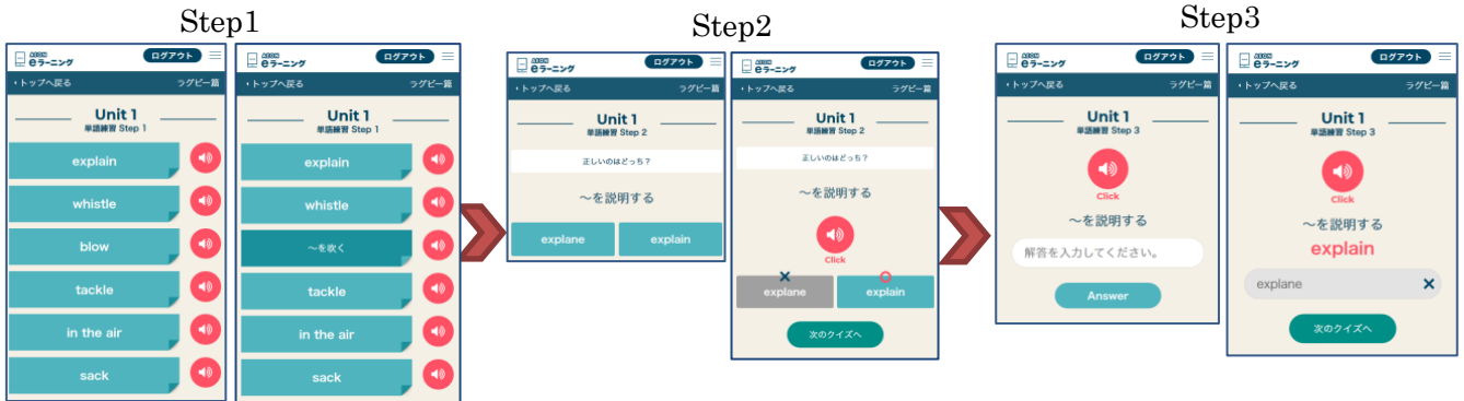
タップで英→日 切替え

各ユニットをそれぞれ3ステップで学習を行います。単語練習は、Step1で単語の意味を暗記、Step2で覚えた単語のクイズ、Step3で覚えた単語のタイピングを行います。