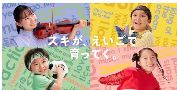
AEON KIDS イーオンこども英会話 アミティー こども英会話専門校

■特設サイト： https://www.aeonet.co.jp/lp/kids/newstyle/