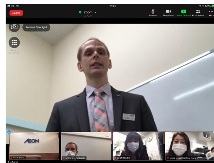
※新型コロナウイルス感染拡大防止対策のため、発表中・写真撮影以外は全員マスクを着用しています。

これまでは西新宿のイーオン東京本社にて開催していた東日本発表会ですが、新型コロナウイルス対策として初めてオンラインでの開催となりました。